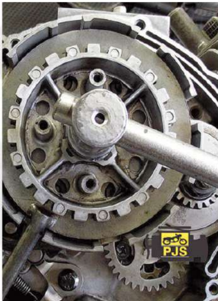
SISTEMAS DE EMBREAGEM