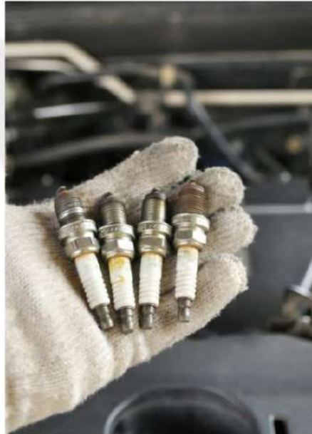
IGNIÇÃO E INJEÇÃO ELETRÔNICA DE MOTOCICLETAS