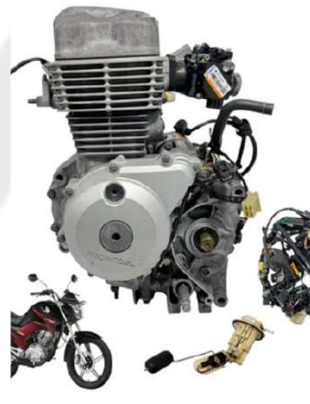
MOTOR E CÂMBIO