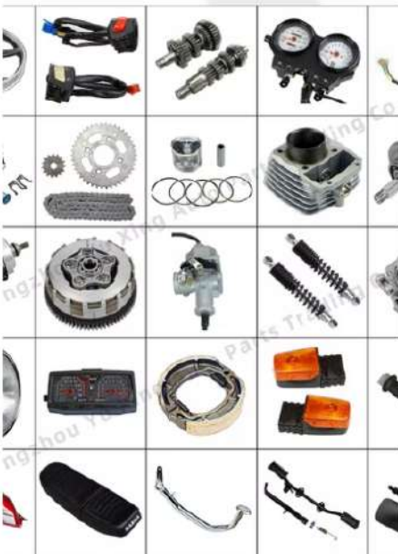
ACESSÓRIOS DA MOTOCICLETA