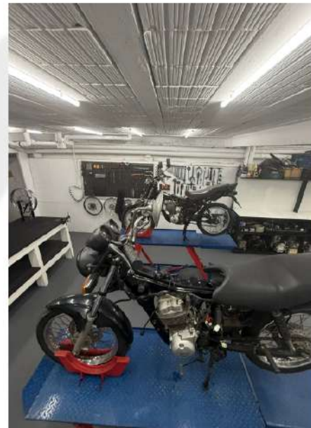
MANUSEIO DE RAMPA