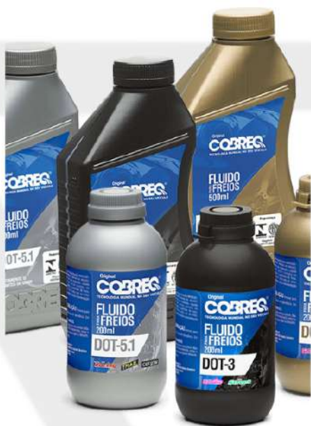
TIPOS DE FLUÍDOS DE MOTORES E FREIO