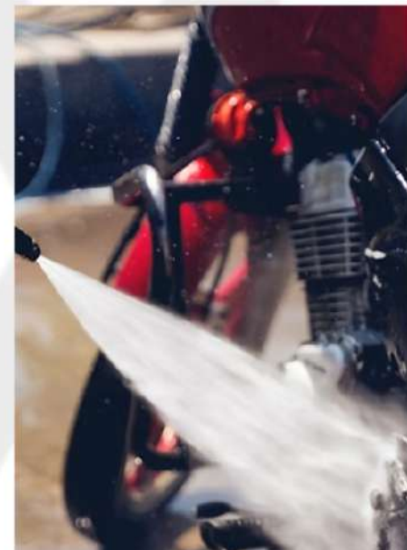
DESMONTAGEM E LIMPEZA