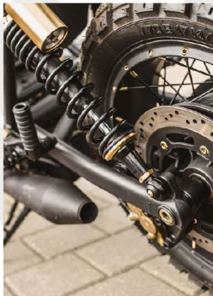
SUSPENSÃO DE MOTOCICLETA E SISTEMAS DE DIREÇÃO