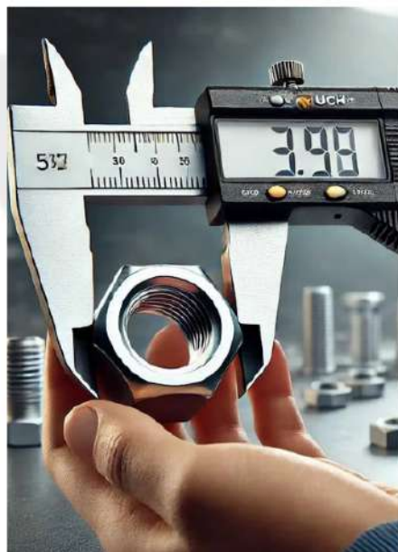
METROLOGIA INDUSTRIAL (CALIBRAGEM DE PEÇAS)