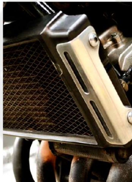
LUBRIFICAÇÃO E ARREFECIMENTO