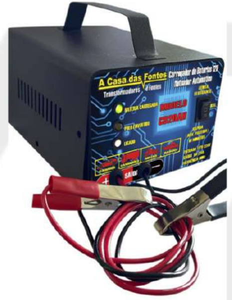
CARGA DE BATERIA