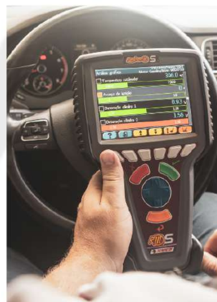
AULAS DEMONSTRATIVAS DE ESCÂNER E CELOSCÓPIO.