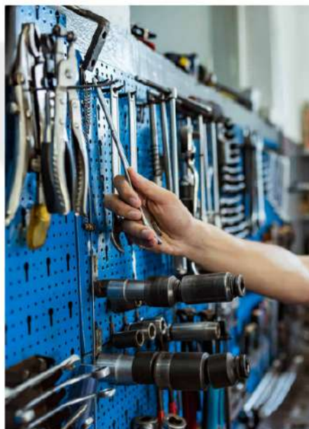
CUIDADOS DE MANUSEIO DAS FERRAMENTAS.