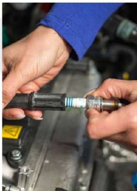
SISTEMA HALL, TIPOS DE BOBINAS, CABOS, VELAS ETC.