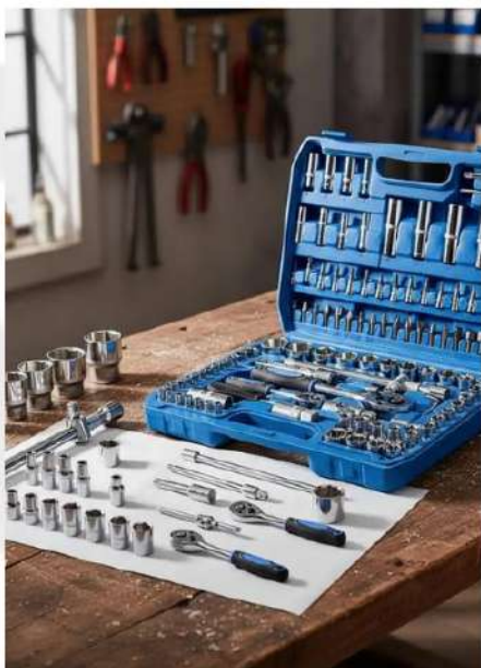
CONHECIMENTO DE FERRAMENTAS ESPECÍFICOS (TORQUIMETRO, CATRACA, JOGO DE PITO).