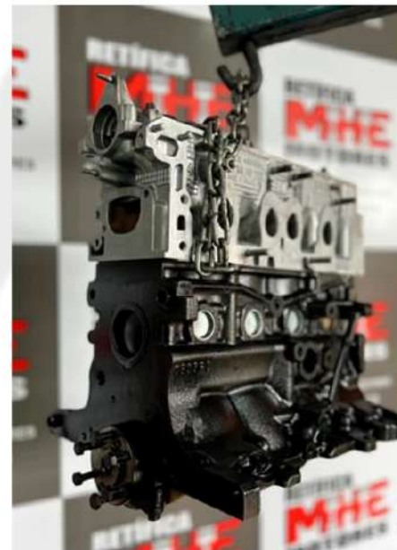
MONTAGEM, DESMONTAGEM E RETIFICA.