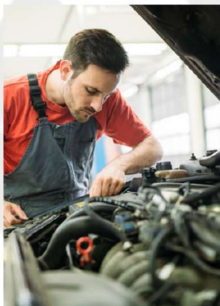
MÃO DE OBRA QUALIFICADA.