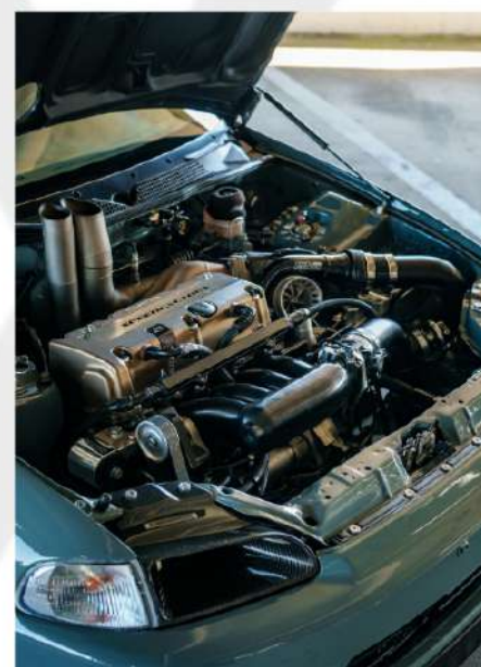
MOTORES 4 E 2 TEMPOS, CICLO OTTO À GASOLINA, ÁLCOOL OU FLEX.