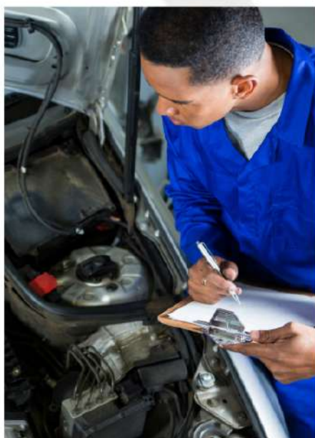
FICHA TÉCNICA DE CUSTOS E ORÇAMENTOS.