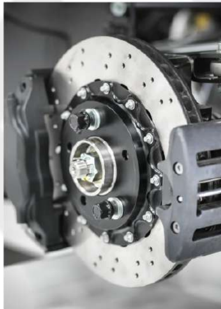
SISTEMAS DE FREIOS E CAIXA DE DIREÇÃO.