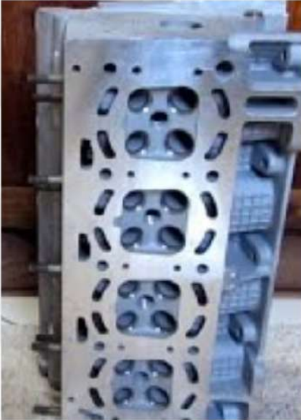
TIPOS DE MOTORES COM 8 E 16 E 32 VÁLVULAS.