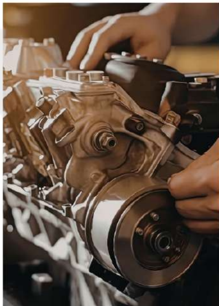
REALIZAÇÃO DE MICRO USINAGEM E LEITURAS DE MEDIDAS DE RETIFICA.