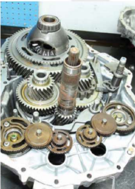
CAIXA DE CÂMBIO. SISTEMAS DE EMBREAGEM TRANSMISSÃO, EIXO CARDAN E CONVERSOR DE TORQUE..