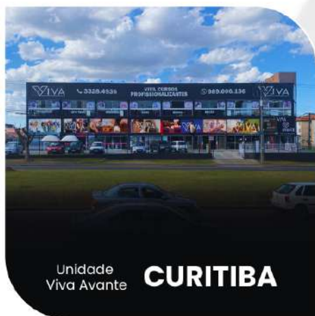
Unidade Viva Avante CURITIBA