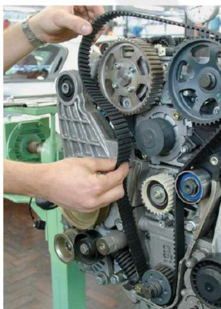
TROCA DE CORREIAS DENTADAS.