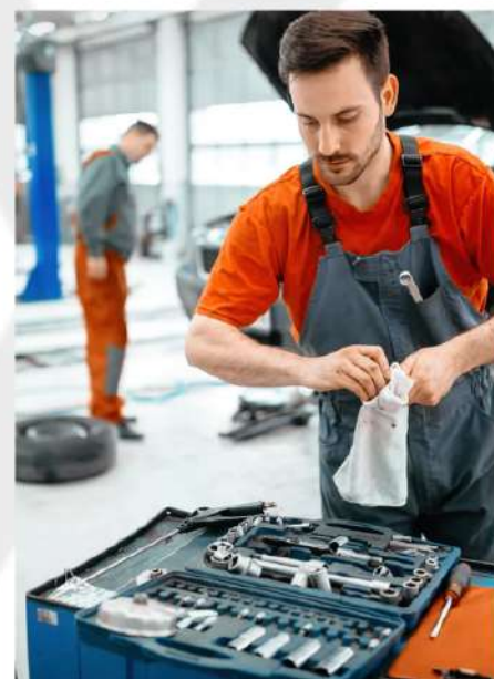
TEORIA SOBRE ORGANIZAÇÃO DE OFICINAS (5S)