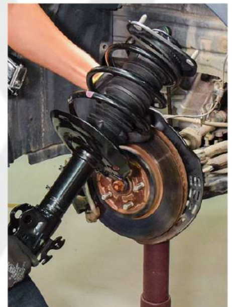
AMORTECEDORES E SUSPENSÃO.