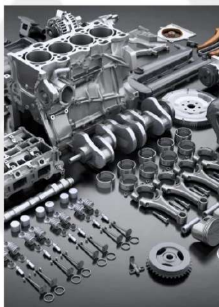
COMPONENTES DOS MOTORES A COMBUSTÃO INTERNA: CABEÇOTE, VÁLVULAS; BLOCO, PISTÕES E BIELA.