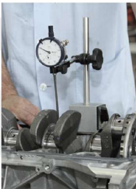
METROLOGIA, CALIBRAGEM E MEDIÇÃO DE PEÇAS.