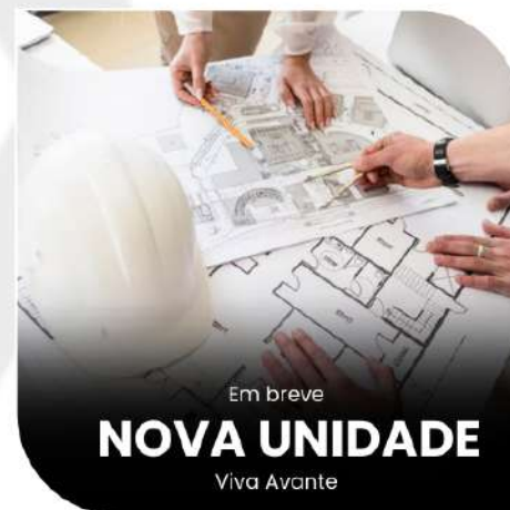
Em breve NOVA UNIDADE Viva Avante