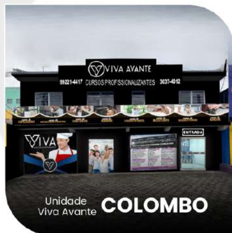
Unidade Viva Avante COLOMBO