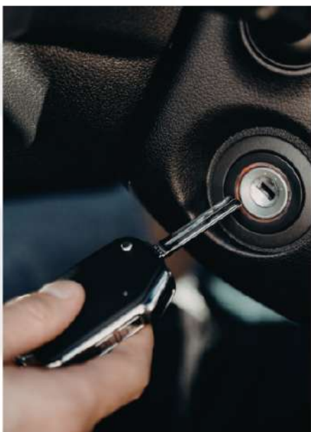
IGNIÇÃO CONVENCIONAL E IGNIÇÃO ELETRÔNICA