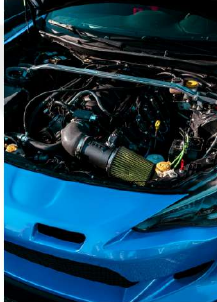
MOTORES ASPIRADOS E TURBO COMPRESSORES.